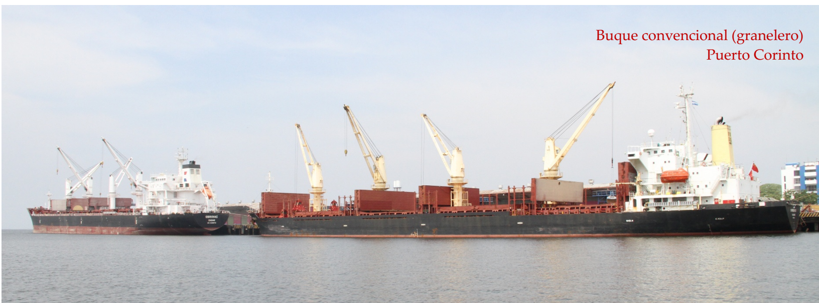
Buque convencional (granelero) Puerto Corinto