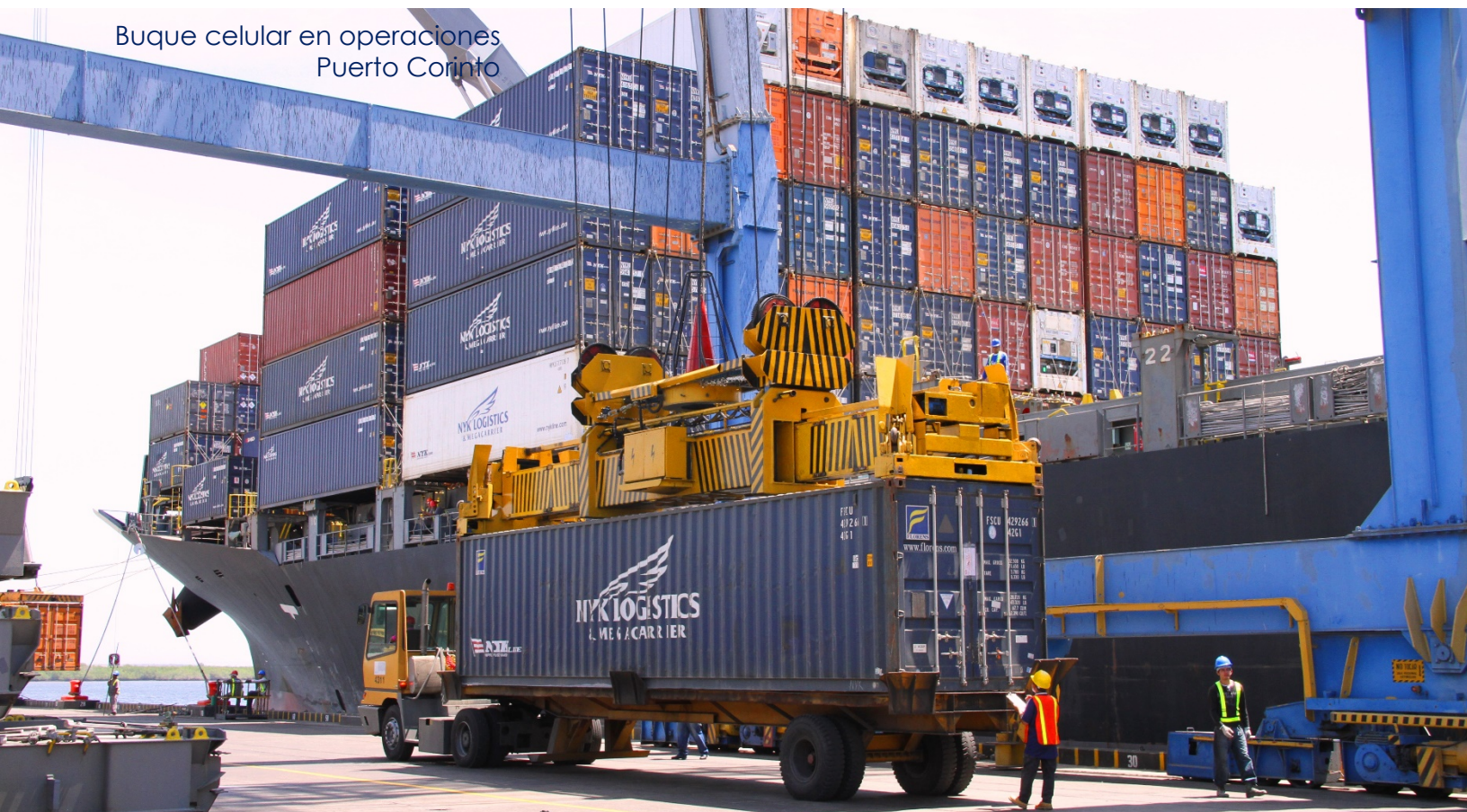
Buque celular en operaciones Puerto Corinto