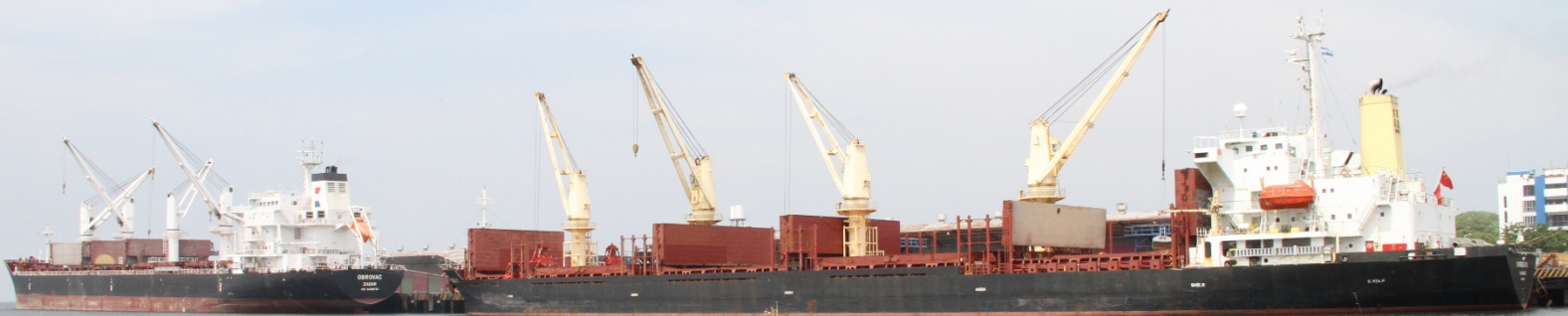
Buque convencional (granelero) Puerto Corinto